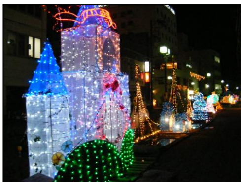
【アクアモールイルミネーション事業】