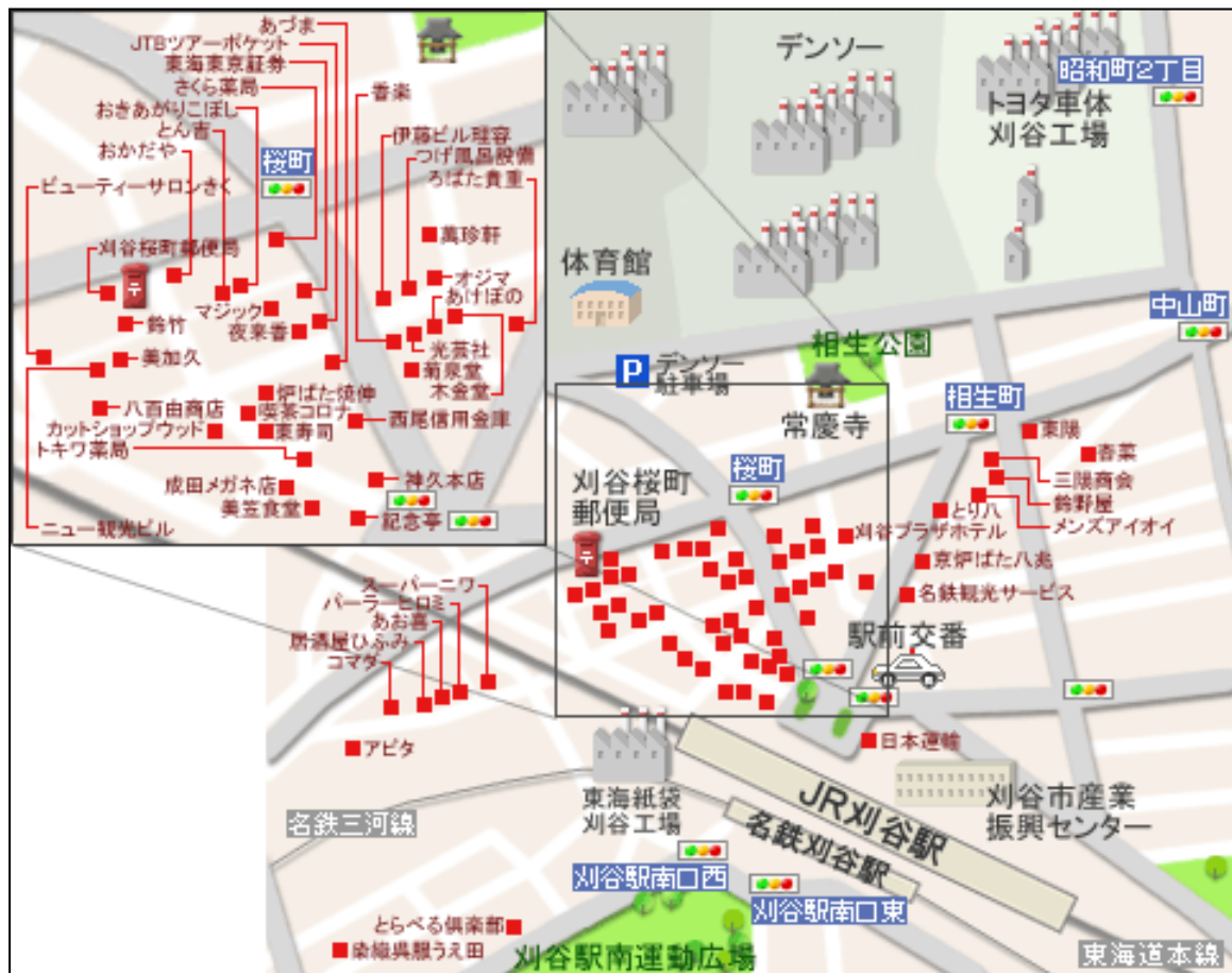
【刈谷駅前商店街マップ】