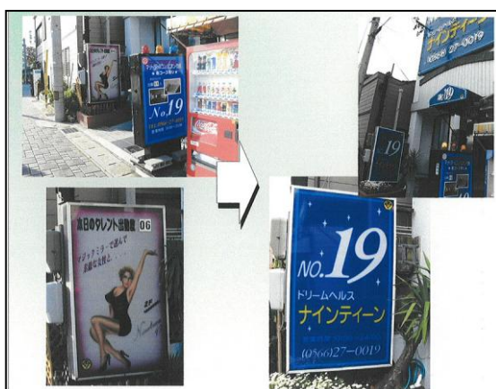
【改善された風俗店の看板】