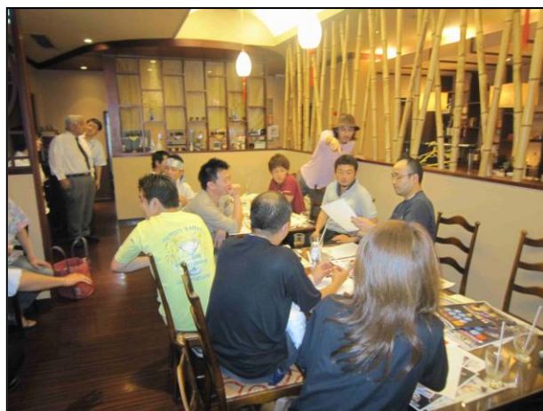
【カリアンナイト実行委員会の様子】